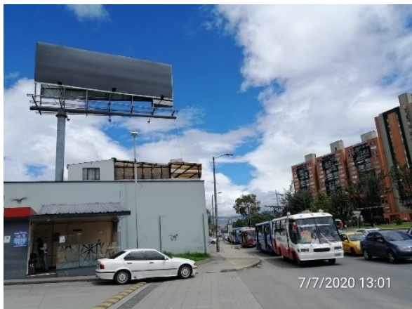
Foto 2. Vista panorámica del predio, del panel y de la estructura de la valla ubicada en la Av. Carrera 68 No. 1A-56 (dirección catastral) orientación NORTE-SUR