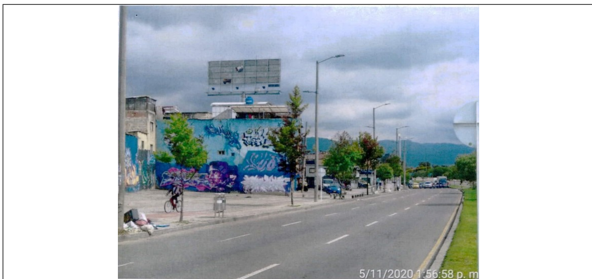
Foto 1. Vista del panel desmontado y de la estructura de la valla ubicada en la Av. Ciudad de Cali/Calle 127B No. 95A-34 (dirección registrada) orientación Norte-Sur. – Del rad. 2020ER197339.