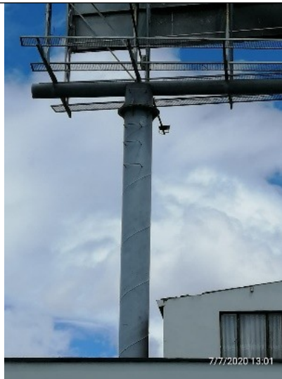
Foto 3. Vista de la estructura de la valla tubular en buenas condiciones y estable.